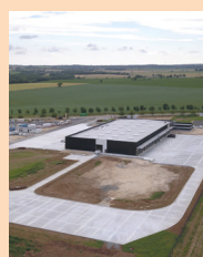
XPO Champs Albert