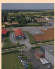
Aftral Baussais 1