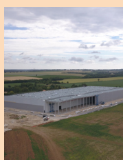
ApproNiort Champs Albert