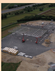
À l'Ombre des Marques Baussais 1